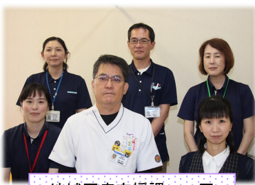
地域医療支援課 一同

当院をご利用される皆様に気軽に声をかけていただける相談室にしたいと思っておりますが、現在は新型コロナウイルス感染拡大防止のため、病院での面談や