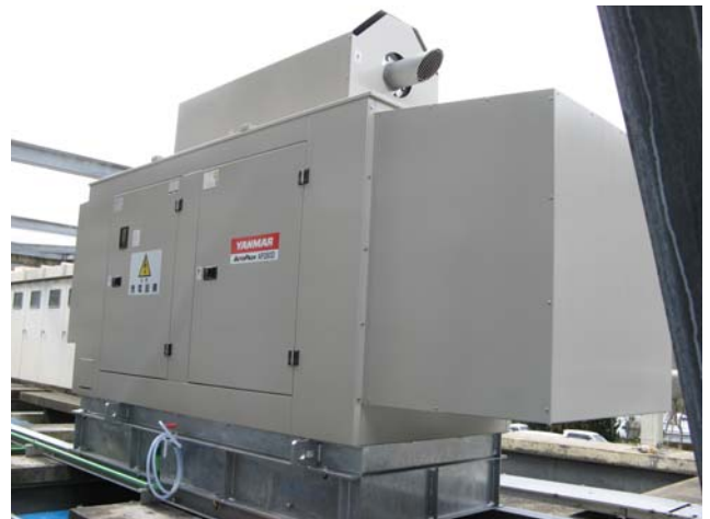
当院2階屋上に設置された自家発電機

上天草地域の安心・安全な医療の提供、信頼される地域医療・病院をめざして、これからも努力してまいりますので、宜しくお願い致します。