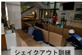
シェイクアウト訓練

訓練の想定は、市の総合防災訓練に合わせた、午前9時00分頃、南海トラフを震源とするマグニチュード9の地震が発生し、上天草市では震度6弱の揺れを観測。津波警報が発表され、傷病者も多数発生しているとしました。