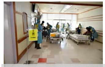
傷病者受け入れ(黄エリア)