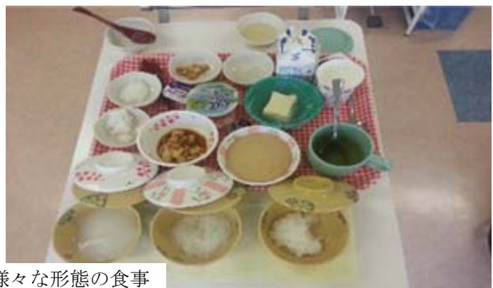
嚥下造影検査と様々な形態の食事