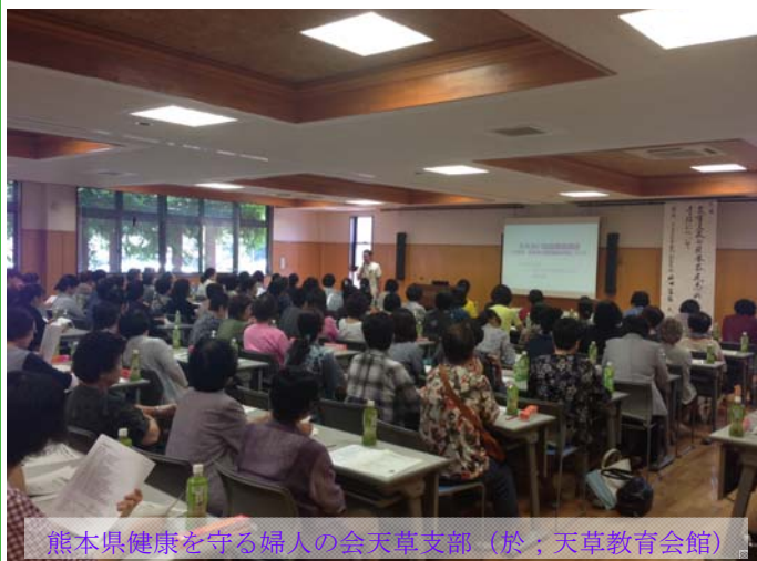
熊本県健康を守る婦人の会天草支部（於：天草教育会館）

幸に天草地方は被災状態もそれほどでもなく済みました。しかし、津波注意報が発令された為、避難された住民もいました。直接の被災はほとんどなかったにもかかわらず、避難され、車中泊を経験された方もおられたようです。本来ならば、避難所を巡回して、マスコミでも毎日のように報道されていたエコノミークラス症候群について予防を働きかけることをすべきだったのではないかととの反省のもと、地域住民の皆様、エコノミークラス症候群とは何か、また災害時に注意すべき循環器疾患について、お話しする機会が持てればと思い、ご案内申し上げましたところ、ひだまりサロン(池の浦地区)、大矢野社協(大矢野老人福祉センター)、在介家族介護教室(赤崎地区)、上天草婦人会(総合センターアロマ)、熊本県健康を守る婦人の会天草支部(天草教育会館)のご依頼で、「災害時、災害後の循環器病予防について」の講演をさせていただきました。