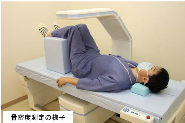
骨密度測定の様子

測定部位は腰椎と大腿骨頸部の2カ所で測定しています。撮影台に仰向けでじっと寝ているだけ、1カ所30秒程度の測定なので、数分で検査は終了します。息止めの必要もありませんので楽に検査が受けられます。また、X線を使っての検査となりますが、被ばく線量は極めて少ないので安心して受けていただけます。