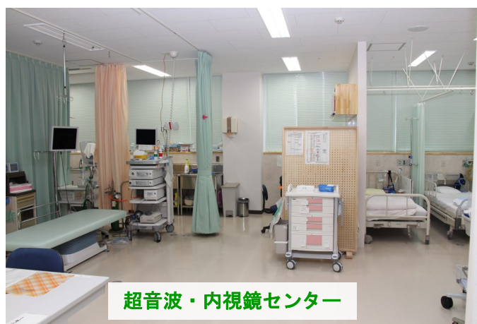
超音波・内視鏡センター