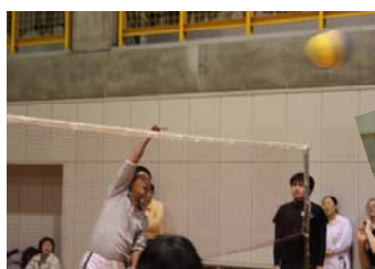
華麗にアタックしているのは……