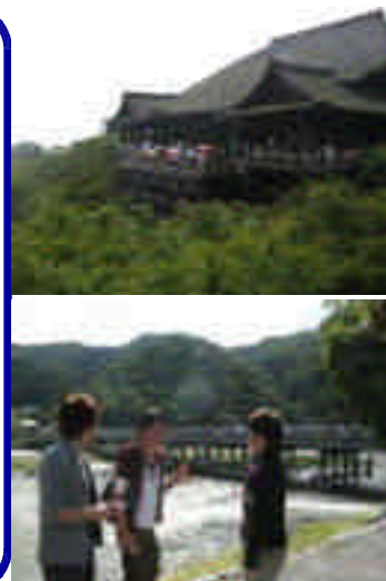
京都学会後の観光(男4人で)、清水寺と渡月橋

10月は学会等が多く、出張する機会が多い時期である。他の病院の取り組みに大変刺激を受け、参考になることが多い。また学会発表で評価を受けることによりこれからの励みにもなる。また新たなモチベーションをもって業務につなげたい。(森)