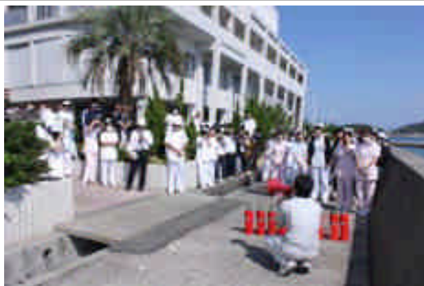
消火器の説明を受ける職員及び看護学生