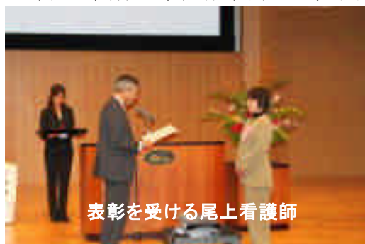
表彰を受ける尾上看護師