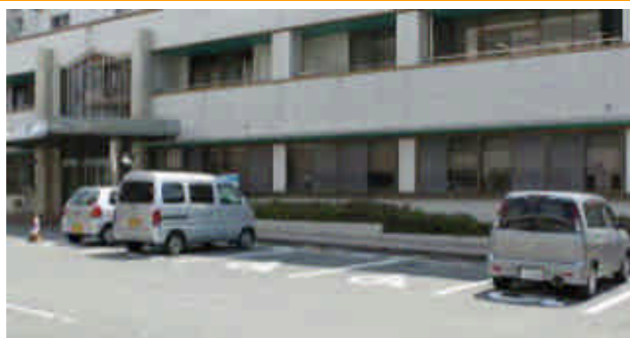
病院正面右側の身障者用駐車場

病院救急外来前の家屋の取り壊しに伴い、病院外来駐車場として利用できるようになりました。外来駐車場の不足により、患者様にはご迷惑をおかけしていますが、 10台ほど駐車出来ます のでどうぞ御利用下さい。