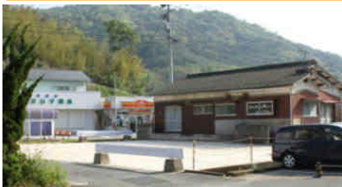
救急外来側から見た駐車場

病院救急外来前の家屋の取り壊しに伴い、病院外来駐車場として利用できるようになりました。外来駐車場の不足により、患者様にはご迷惑をおかけしていますが、 10台ほど駐車出来ます のでどうぞ御利用下さい。